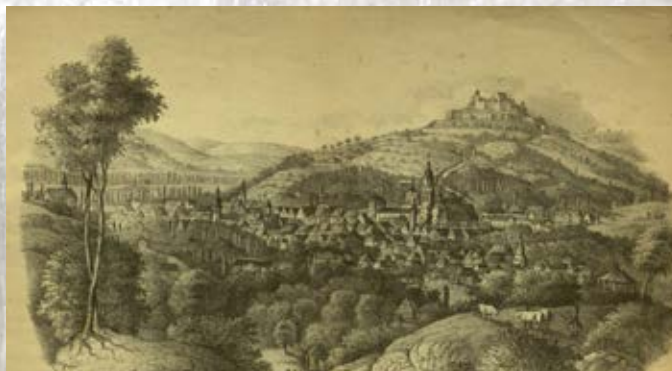
Coburg, 19. Jh.